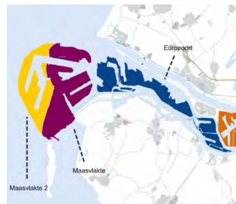
Europoort, Maasvlakte en Maasvlakte 2