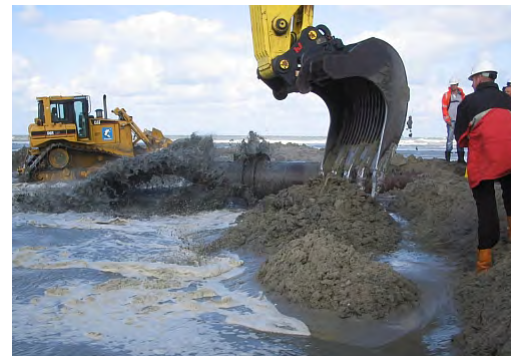
Start aanleg Maasvlakte 2