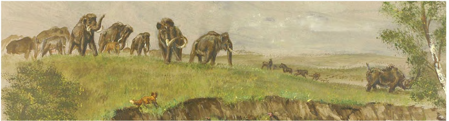
Mammoetsteppe, het landschap in het Noordzeegebied, 45.000 jaar geleden (illustratie: Remie Bakker, Manimal Works)

Tijdens de aanleg van Maasvlakte 2 zijn sporen en resten gevonden van meer dan 30.000 jaar geleden. Toen zag het landschap er hier heel anders uit.